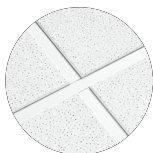
GEORGIAN Beveled Tegular com perfil PRELUDE tipo "T" de 15/16"