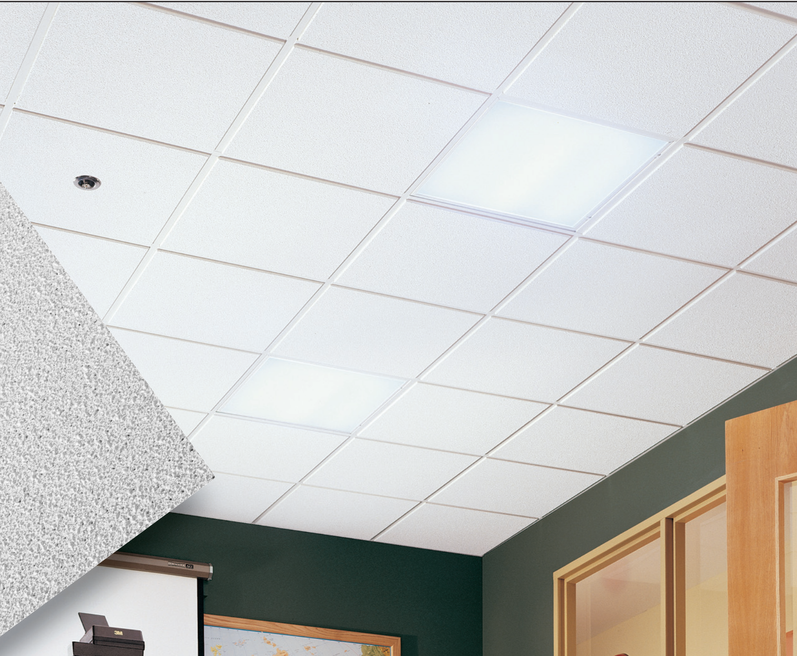
GEORGIAN Beveled Tegular com perfil PRELUDE® tipo "T" de 15/16"